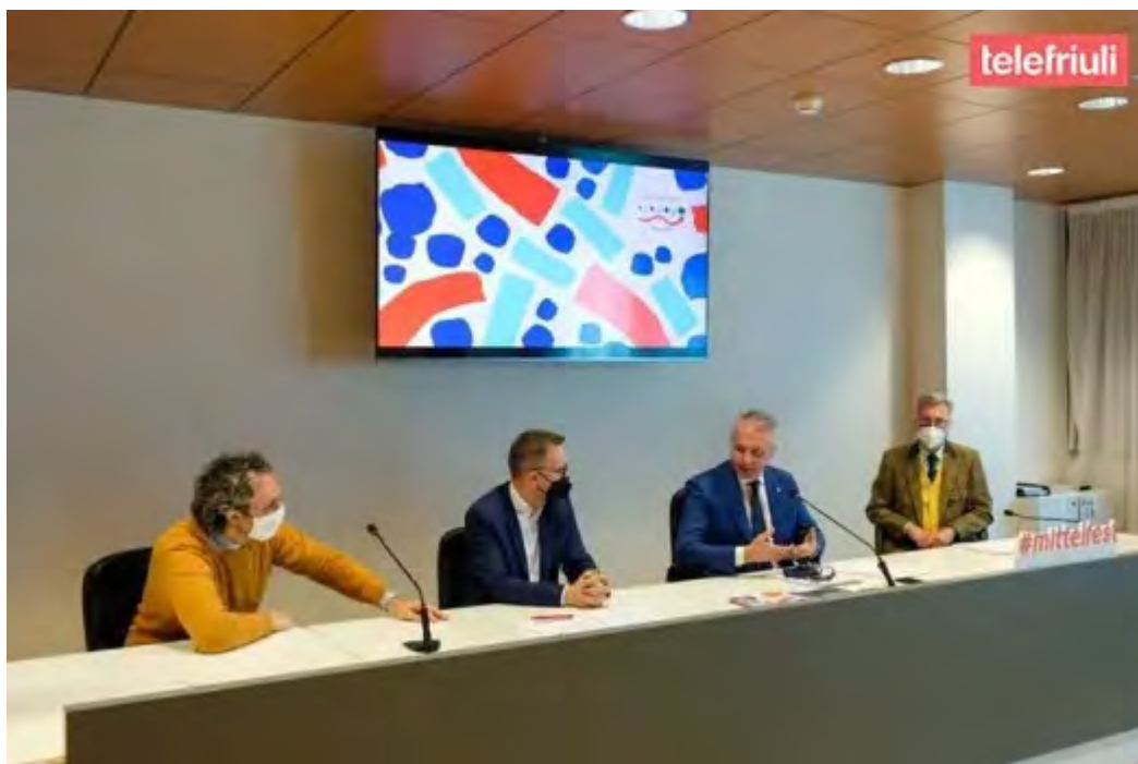
La conferenza stampa del 18 novembre 2021