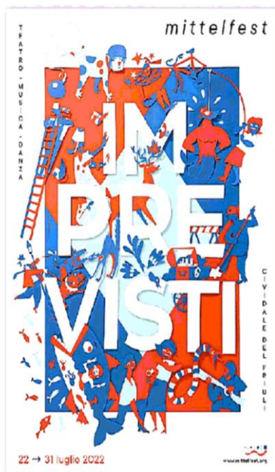
La locandina per l'edizione 2022 del Mittelfest

Un collage di immagini per l'edizione 2022 dedicata agli imprevisti