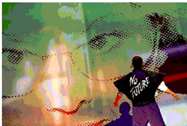
Viaggio nel tempo Una scena di «Back: to No Future» del collettivo Gob Squad

«Post» esprime un'idea di futuro e di superamento, ma non può prescindere da uno sguardo artistico, politico e critico sui temi del presente. Li affondano le loro radici gli 8 spettacoli-progetti che comprendono anche molte iniziative collaterali di coinvolgimento della cittadinanza e vanno a comporre il cartellone di uno degli avamposti culturali più vivi della città.