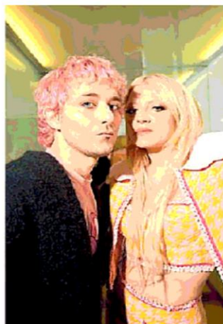
La rappresentante di lista