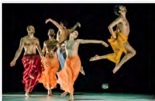
Le Quattro Stagioni - Compagnia Arearea - Politeama Rossetti di Trieste

Luoghi inediti per una nuova modalità di esibizione e di ascolto, dove l'arte e la natura si incontrano ed entrano in risonante armonia: è questa l'inconfondibile cifra artistica di Palchi nei Parchi, la rassegna ideata dal Servizio foreste e Corpo forestale della Regione FVG, sotto la direzione artistica della Fondazione Luigi Bon, dove i palchi che ospitano gli artisti sono frutto del lavoro delle squadre di operai della Regione che hanno trasformato e dato nuova vita agli alberi